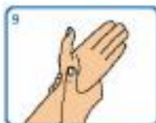
9 Fregar cada pulso cos man oposta