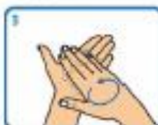
3 Fregar palma sobre palma