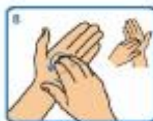
8 Fregar as unhas dos dedos sobre a palma da man contraria con movemento circular