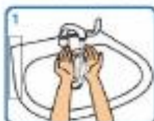
1 Humedecer as mans