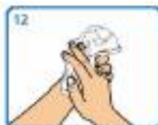
12 Secar cunha toalla de papel descartable