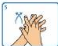
5 Fregar palma sobre palma dos dedos entrelazados