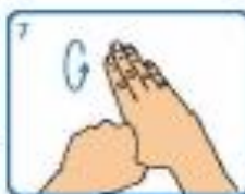
7 Fregar os polgares restante un movemento rotatorio