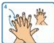
4 Fregar palma sobre dorso dos dedos entrelazados e viceversa