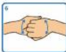
6 Fregar a dorso dos dedos sobre a palma oposta